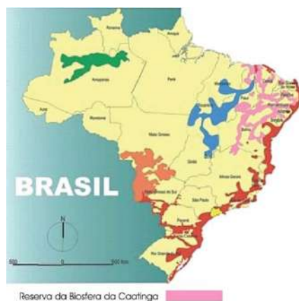
Reserva da Biosfera da Caatinga